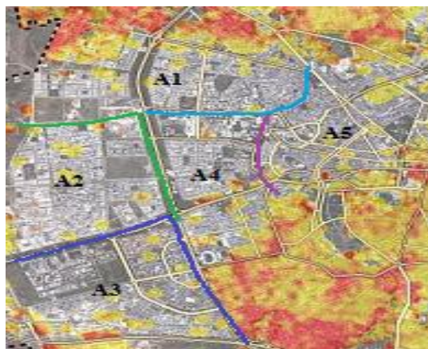
Grafica 2: Áreas a Maximizar con Carencia de Cobertura

en colores determinados para poder determinar su potencia e intensidad de conectividad la cual es medida en Decibelios (-Db) indicando que entre mejor sea la señal de la conectividad en la red se subdividide por colores la potencia de la red como se describe a continuación.