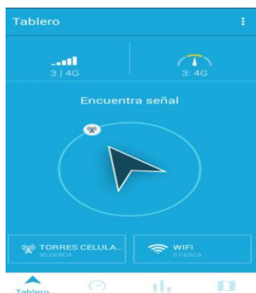
Grafica 5: Interfaz Open Signal