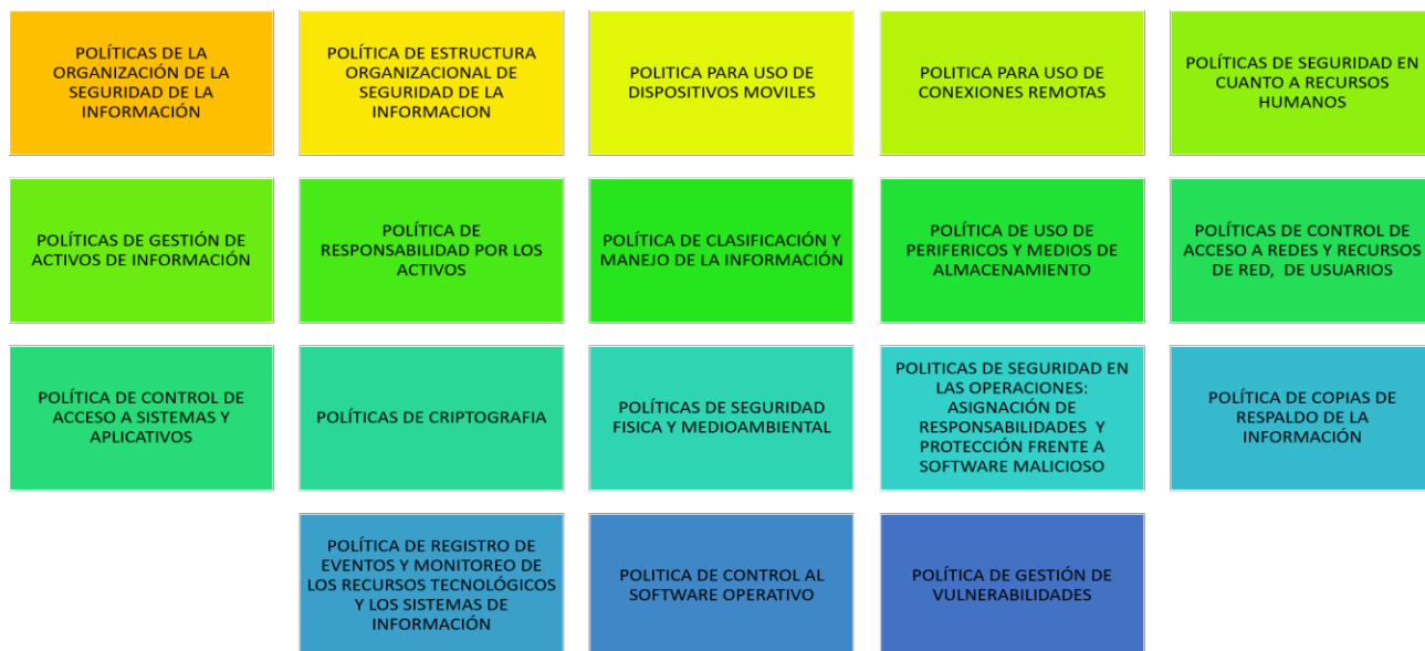
Esquema 5 Elaboración propia