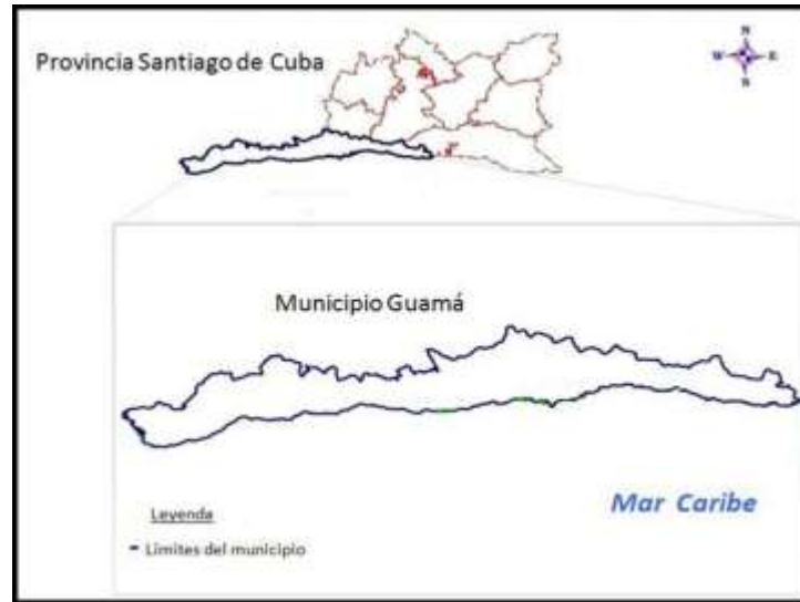
Figura 1. Límite del municipio costero Guamá