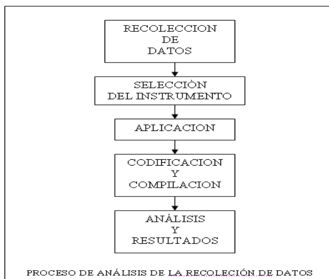
Gráfico No. 1.- Proceso de Análisis de Recolección de Datos

Evaluación de la plataforma de Tecnologías de Información y Comunicación (TICS) en el sistema semipresencial de educación a distancia