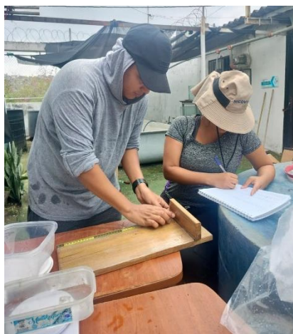
Figura 4 Toma de muestras

El muestreo se realizó de forma bimensual, seleccionando aleatoriamente 22 tilapias y 5 langostas por unidad experimental, registrando variables como peso y talla bajo condiciones controladas durante horas de la mañana para minimizar el estrés de los organismos.