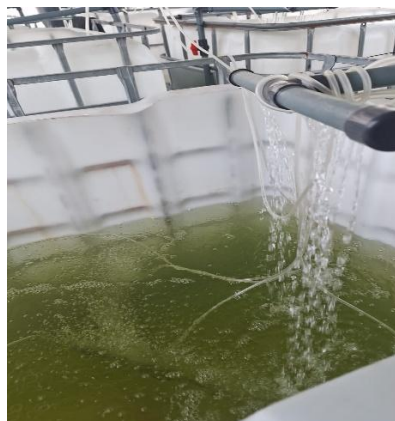
Figura 3 Recambio parcial de agua

El mantenimiento del sistema se realizó mediante la integración de métodos tradicionales y modernos de forma complementaria. Entre las prácticas tradicionales se incluyeron el recambio parcial de agua en un rango del 10–20 % del volumen total, el sifoneo y la remoción de sedimentos acumulados, así como el control visual continuo del estado del cultivo. En este contexto, a pesar de que la langosta de agua dulce ( Procambarus clarkii ) es una especie bentónica que habita en el fondo de los tanques y genera procesos naturales de bioturbación, la remoción de sedimentos se realizó de manera parcial, selectiva y controlada, evitando alterar significativamente su hábitat y comportamiento. Por su parte, los métodos modernos consistieron en el monitoreo continuo de los parámetros físico-químicos mediante sensores IoT, el registro digital de datos y la generación de alertas tempranas. La combinación de estas estrategias permitió un control eficiente de variables como la turbidez y el oxígeno disuelto, evitando proliferaciones excesivas de fitoplancton y garantizando la estabilidad y sostenibilidad del sistema acuícola.