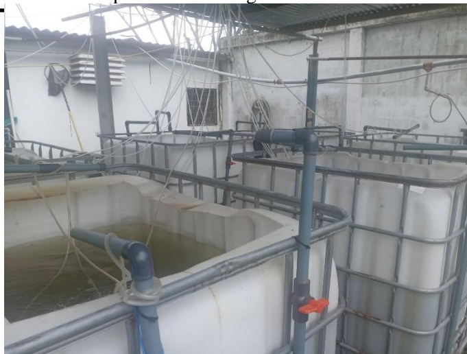
Figura 1 Infraestructura del cultivo multitrófico

El sistema de monitoreo IoT estuvo conformado por componentes de hardware y software integrados. En cuanto al hardware, se utilizaron placas Arduino Uno, un microcontrolador ESP32 y sensores para la medición de pH, temperatura y turbidez. En el ámbito del software, se empleó el entorno de desarrollo Arduino IDE, la plataforma IoT ThingSpeak y el protocolo de comunicación MQTT. Este sistema permitió la recolección, transmisión y visualización de datos en tiempo real, facilitando una gestión eficiente del cultivo mediante la toma de decisiones basada en información continua y precisa.