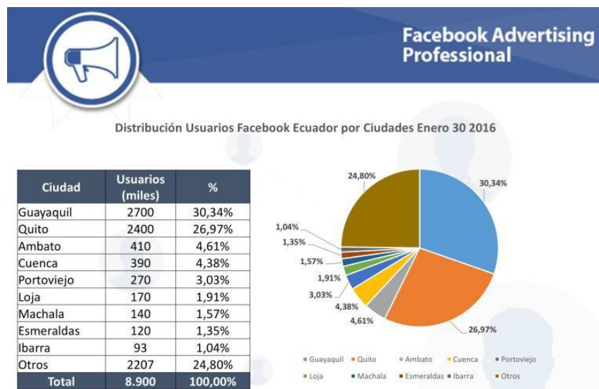
Figura N° 2.- Distribución usuarios Facebook Ecuador

Dentro de las ciudades con mayor población de empresas en redes sociales podemos situar a Guayaquil en el primer lugar, seguidos por Quito y Cuenca.