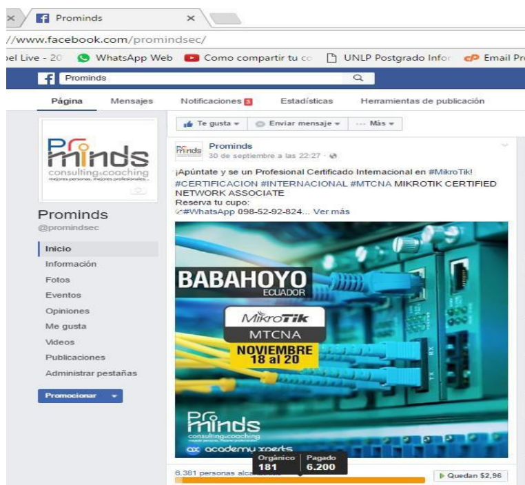
Cuadro N° 3.- Comparación entre alcance orgánico y pagado