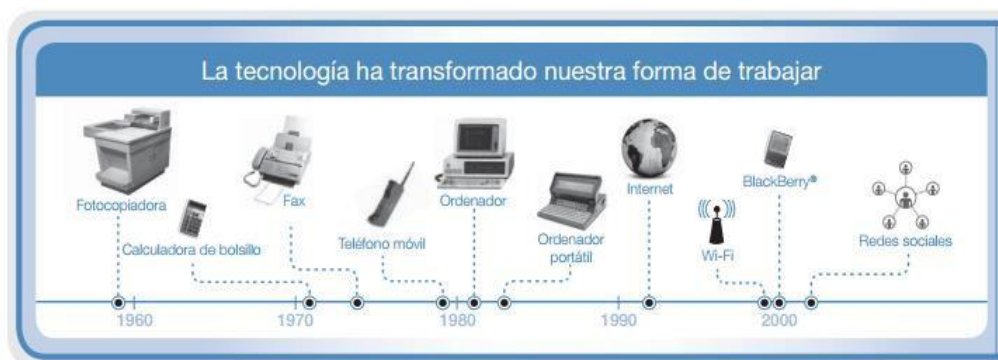
Figura N°1.- Evolución de la tecnología