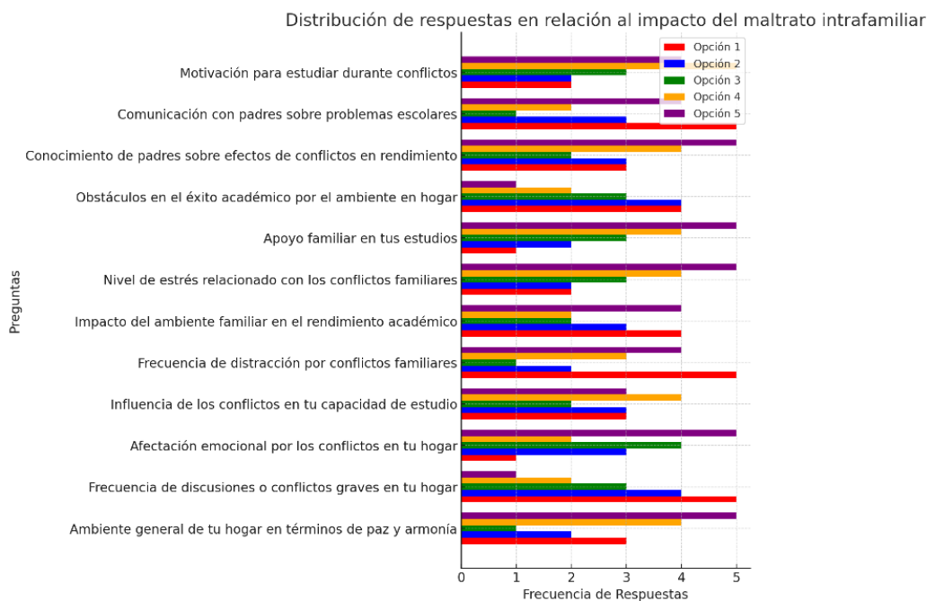
Figura 2: Distribución de respuestas en relación al impacto del maltrato intrafamiliar

En la figura 1 se observa el promedio de calificaciones en relación a la exposición de maltrato intrafamiliar, en el cual se identifica 80 estudiantes que no han sido expuestos al maltrato con un promedio de calificaciones de 8,3/10, frente a 38 estudiantes expuestos al maltrato con un promedio de calificaciones de 6,5/10. De igual manera, se establece una desviación estándar para el primer grupo de 0,9 mientras que, en el grupo expuesto al maltrato, la desviación correspondió a 1,2.