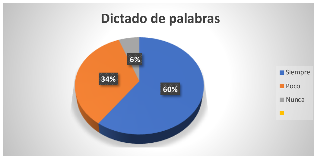
Gráfico 2. Dictado de palabras