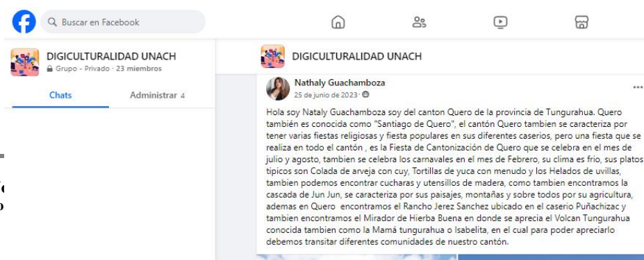
Figura 1. Presentación del estudiante- lugar origen y descripción.

Las redes sociales (Facebook) abren camino hacia un fortalecimiento de la interculturalidad toda vez que tanto en el campo social y educativo sus integrantes participan más activamente sobre todo por la idiosincrasia de quienes habitan en regiones como la Sierra ecuatoriana de ser muy introvertidos, no obstante, el aprovechamiento lo constituyen esos procesos innovadores que atraen la atención de quien les da uso.