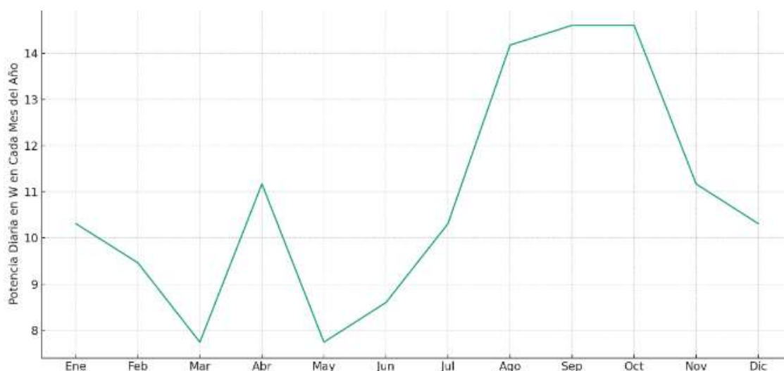
Figura 2. Potencia diaria fotovoltaica en W en cada mes del año.

Estos valores de potencia se pueden apreciar en la figura 3