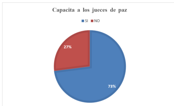
Gráfico 7. Capacita a los jueces de paz