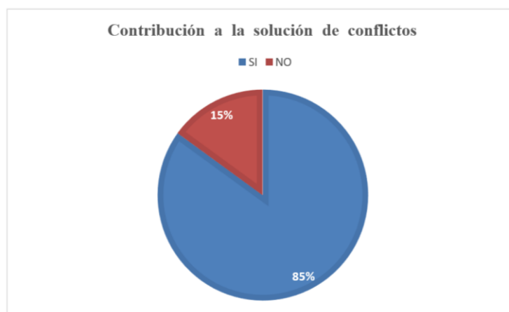
Gráfico 1. Solución de conflictos