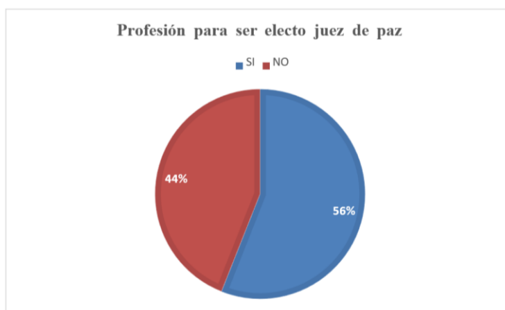
Gráfico 4. Profesión para ser electo juez de paz