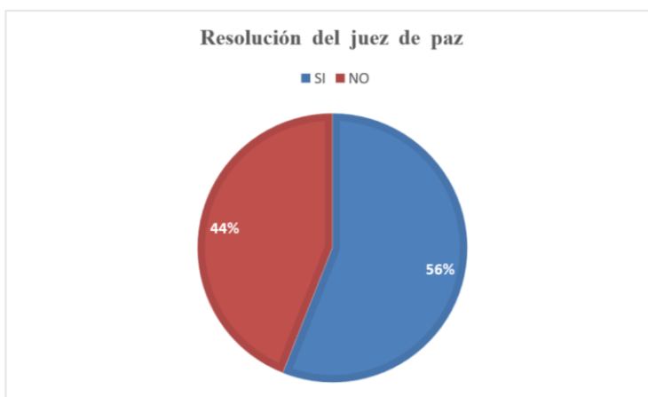
Gráfico 10. Resolución del juez de paz