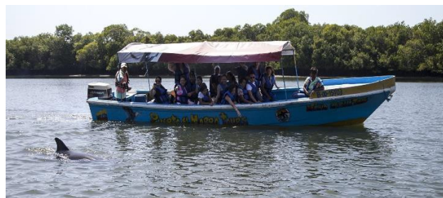
Figura N° 3.- Avistamiento de Delfines, (El morro la Reserva Hábitat de los Delfines, El Comercio)

Según el reportaje El maravilloso Puerto el Morro, (2014) “Llegar a Puerto El Morro es entrar en un espacio de cambio, de transformación constante, es vivir la evolución en carne de sus habitantes. La pesca fue por épocas, por centenares de años, la principal de sus actividades, además de la recolección de moluscos. Pero hace una década se dieron cuenta de que el escenario de sus rutinas resultaba novedoso y atractiva para muchos, que había gente dispuesta a pagar solo por conocer su entorno, por caminarlo un momento, por compartir con ellos el estuario y sus maravillas”. Este periodista en su reportaje mostro la biodiversidad de la zona, señalando la oportunidad que tienen los turistas de visitarlo y además resaltando que el turismo en la zona es de baja costo pero sus moradores atienden con alta calidad y predisposición, se muestra en la figura No. 3 el avistamiento de delfines