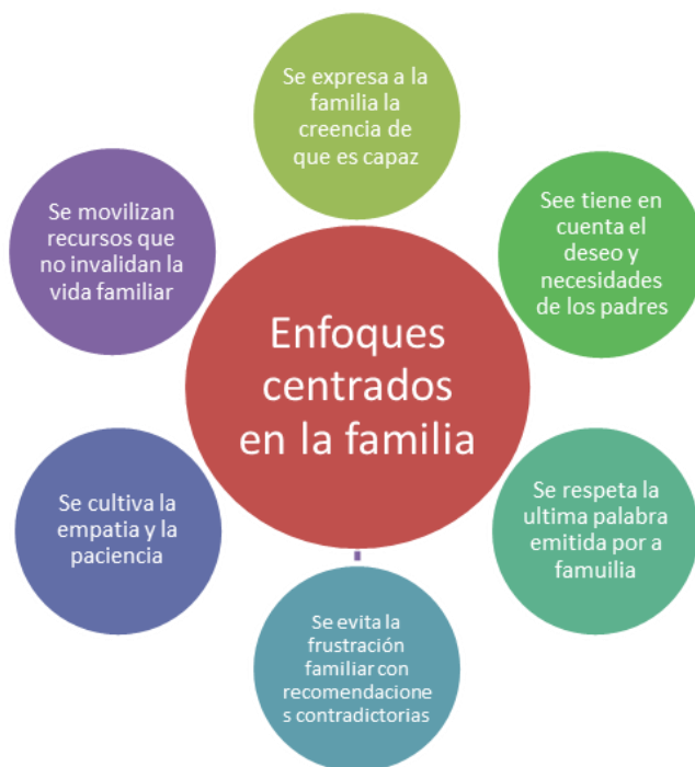
Figura 7: Principios del enfoque centrado en la familia