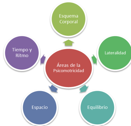
Figura 4: Áreas de la Psicomotricidad

Fuente: Elaboración propia. Tomado de Apan, et al. (2020).