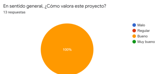
Figura 2: Valoración del proyecto