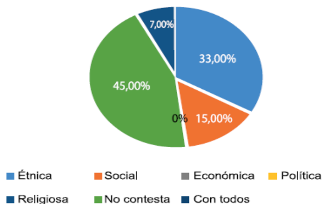
Fig. 1. Factores que influyen en la interacción docente y estudiantes.

Se puede observar que 33% de docentes encuestados lo hace según la condición étnica y el 15% por lo social; hay un 45% que simplemente no contesta y un 7% que dice relacionarse indistintamente, es decir, sin importar la cuestión étnica, social, económica, política o religiosa.