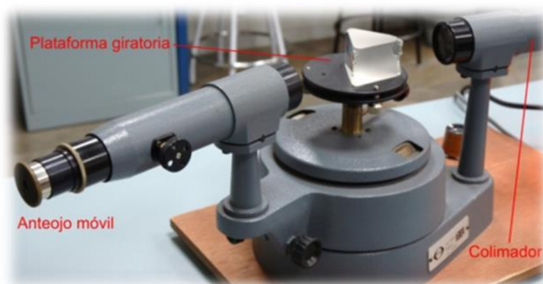
Figura 1: Componentes principales del espectrogoniómetro

Anteojo: Consta de un retículo, un ocular de Gauss y de un objetivo. El ocular está formado por dos lentes y situado entre ellas una lámina de vidrio a 45^\circ con el eje. Esta lámina de vidrio tiene como objetivo reflejar la luz que recibe de una bombilla adosada al ocular. Esta luz que se refleja en el vidrio va a iluminar el retículo y de esta forma se puede ajustar en anteojo.