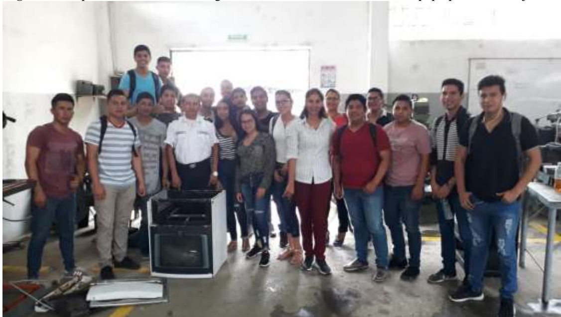
Figura 3: Grupo de alumnos UTM integrados en el reto de construcción de equipo para el reciclaje de materiales

asignaturas, como: Fluidos, termodinámica, cálculo, física, entre otras, e incluso como mediante las TICs y consultas a “expertos” pudieron alcanzar el objetivo del reto. La satisfacción y la motivación estuvieron presentes a lo largo de todo el aprendizaje tanto en alumnos como en el docente, lo que se ilustra mediante la figura 3.