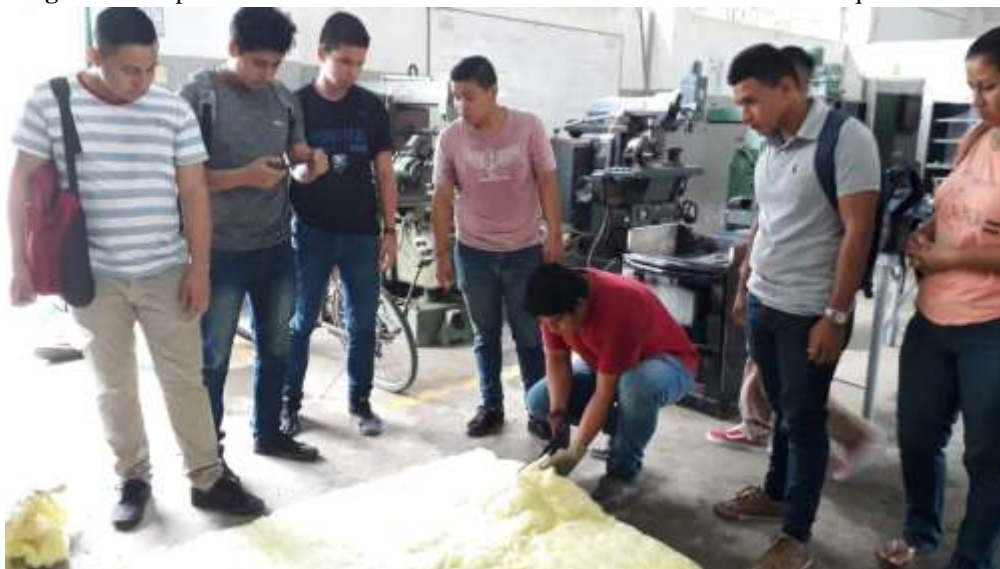
Figura 2: Grupos de alumnos mostrando avances en la construcción de la maquina recicladora

Finalmente, se alcanzaron a comprender los contenidos de la asignatura de forma teórica y práctica, y a su vez, se logró simultáneamente integrar los contenidos transversalmente impartidos hasta el cuarto nivel de la carrera. Cada uno de los equipos, lograron superar el reto, desde su visión y ámbito de respuesta, respetando criterios y pautas fijado por el docente, la capacidad de respuesta obedeció a un trabajo colaborativo, donde se integraron personal que trabaja en los laboratorios de ingeniería mecánica e incluso familiares con sus conocimientos, quienes también se sumaron al reto, para apoyar a cada uno de los equipos. En la exposición realizada mediante videos, los estudiantes indicaron como les fueron aportando ideas, los conocimientos que obtenidos en diferentes