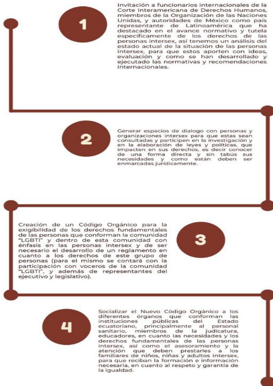
Gráfico 3: Representación gráfica de la propuesta.