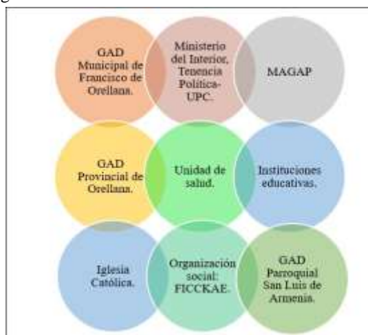
Ilustración 3: Ejemplo Diagrama de venn de las instituciones Herramienta de Gestión utilizada en los DRP.