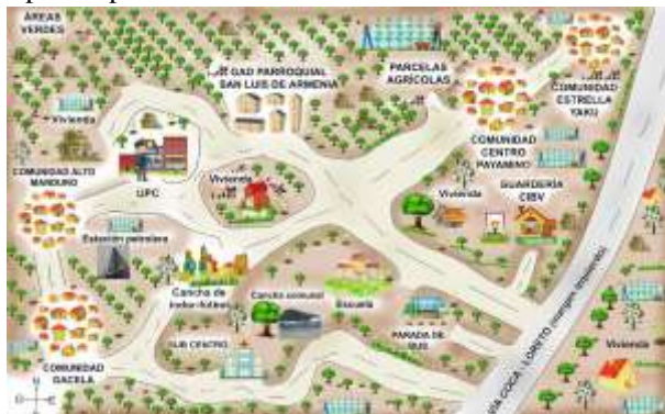
Ilustración 2: Ejemplo Mapa de Comunidad Herramienta de Gestión utilizada en los DRP.