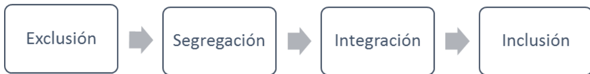
Ilustración 2. Ruta de la inclusión (Elaboración propia)

Desde el punto de vista educativo, autores como (Parrilla, 2006) habla de dos fases, anteriores a la de la integración, armando así un camino completo desde la exclusión hasta la inclusión (ver ilustración 2):