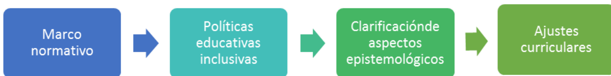
Ilustración 1. Retos de la educación inclusiva.

Partiendo de las ideas presentadas anteriormente señalan la preeminencia de la de adecuar los aspectos medulares identificados a nivel de Latinoamérica y el Caribe, tales como el marco normativo adecuado, políticas y programas educativos, la clarificación epistemológica en relación a la educación inclusiva, la identificación de los grupos considerados como vulnerables y el diseño de un currículum que responda la igualdad de oportunidades y la inclusión entre otros aspectos.