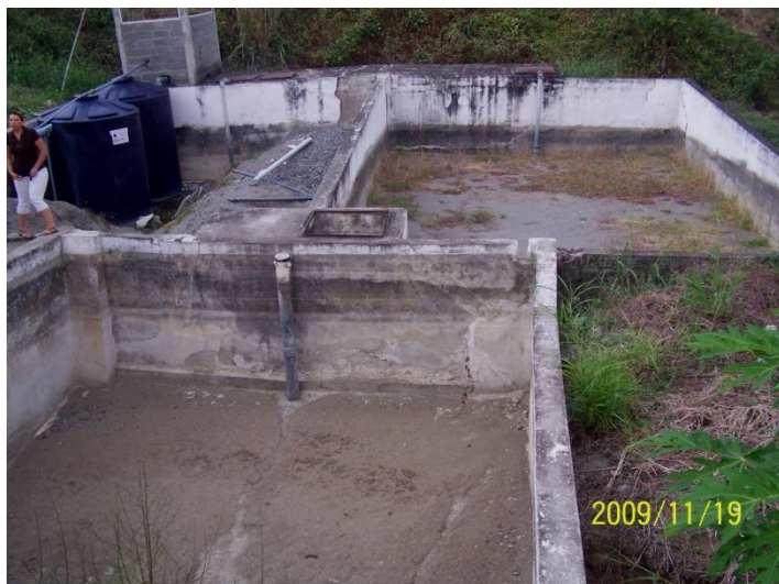
Figura 4. Condición estructural de la planta de tratamiento de 20 (L/s)