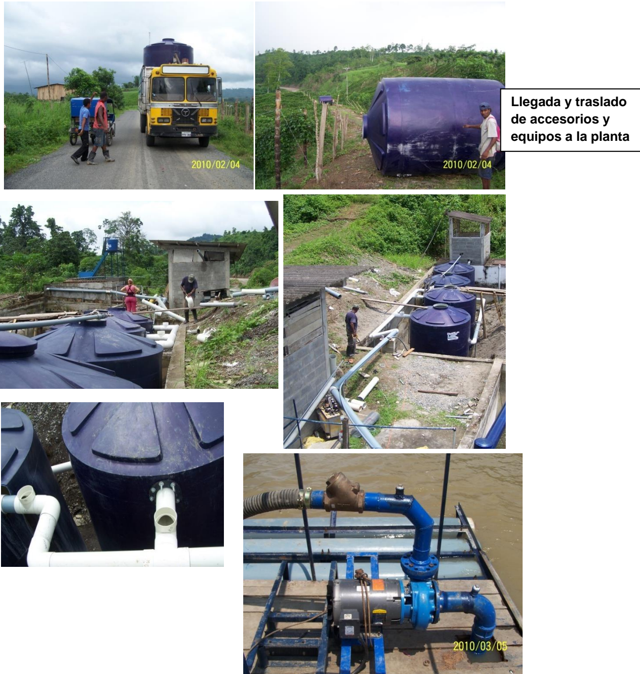
Figura 1. Descripción gráfica de equipos y accesorios, y de los procesos de montaje