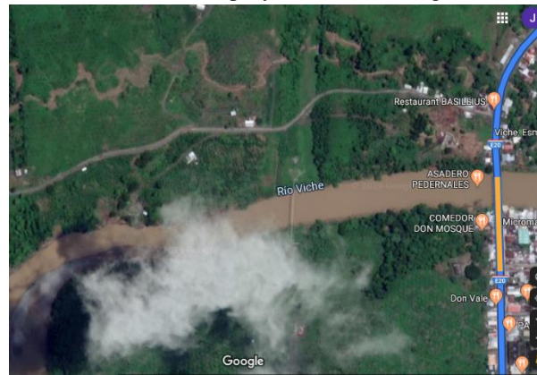
Figura 1. Zona de influencia del proyecto Planta de Agua Potable de Viche

Ubicación: a 47.7 Km de la ciudad de Esmeraldas