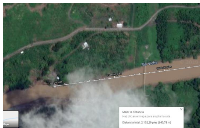
Figura 2. Sector de la captación y de tratamiento en el río Viche

(A) Ubicación de la planta potabilizadora a 650 m de distancia de Viche