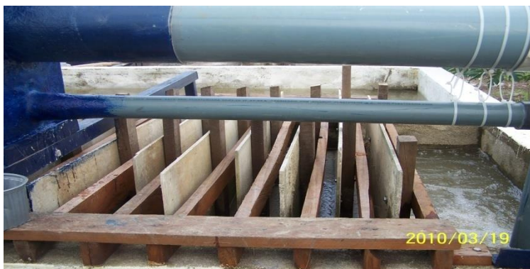
Descarga del agua coagulada en el canal de flujo rápido