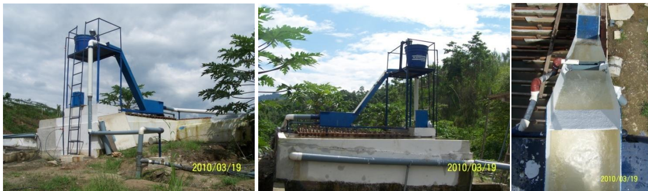
Figura. 2 imágenes del sistema de mezclado rápido y coagulador

Vistas de la torre contenedora de: Control – dosificador de coagulante – dosificador de cloro – sistema de mezclado rápido