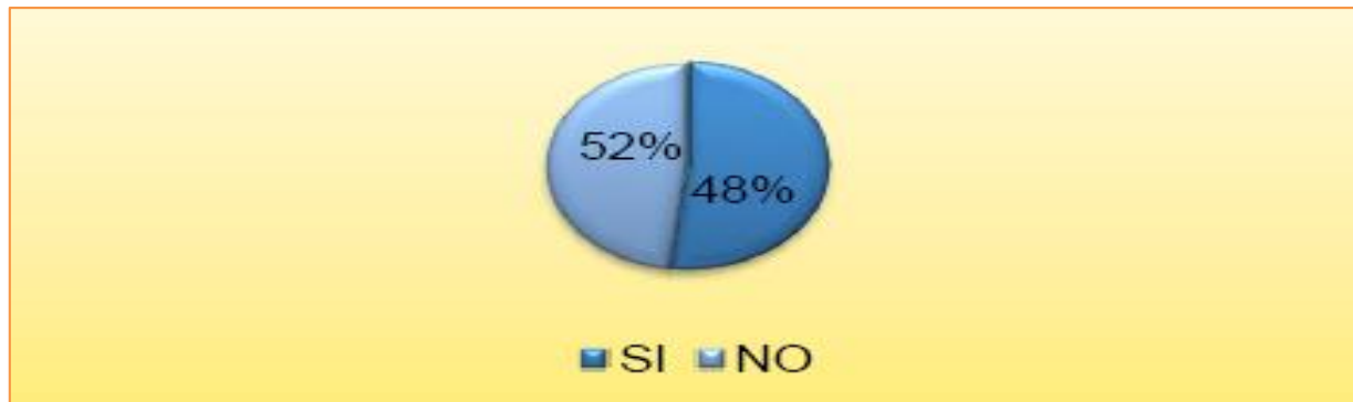
Figura 5 Distribución de mujeres encuestadas según la pregunta ¿Se ha visto afectada por algún tipo de violencia psicológica? en Loja, Ecuador

Fuente. Información proporcionada por los resultados de la aplicación del instrumento. Elaboración propia (2019)