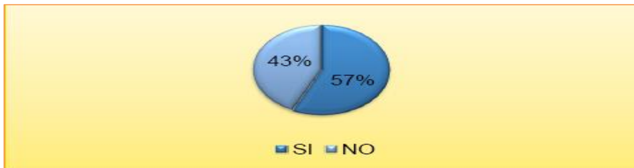
Figura 4 Distribución de mujeres encuestadas según la pregunta ¿Se ha visto afectada por algún tipo de violencia sexual? en Loja, Ecuador

Fuente. Información proporcionada por los resultados de la aplicación del instrumento. Elaboración propia (2019)