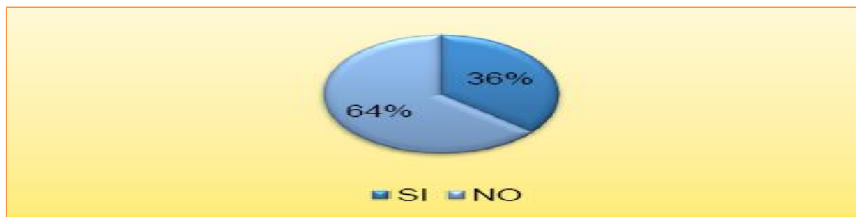
Figura 1 Distribución porcentual de las mujeres según conocimiento sobre las leyes que amparan a la mujer en Loja, Ecuador