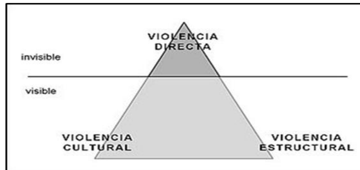
Figura 1. Esquema de la violencia según Johan Galtung Fuente: Cases (2016)

Fuente: Información tomada de Cases (2016). Elaboración propia (2019)