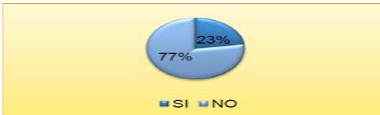
Figura 2 Distribución de mujeres encuestadas según la pregunta ¿Usted considera que existe igualdad de género en su hogar? en Loja, Ecuador